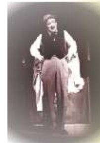
Comp. Piccoli Trasporti Teatrali di Bologna IL SIGNORE delle FIERE